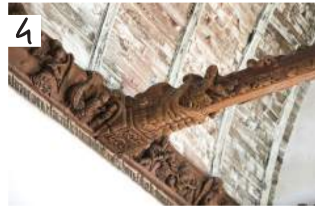
4. Sablières de l'église St Maurice