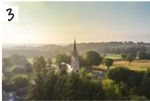
3. Guéhenno, Commune du Patrimoine Rural de Bretagne