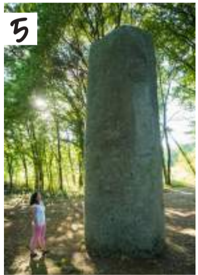
5. Menhir de Kermarquer