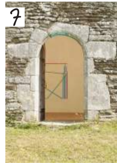
7. L'art dans les chapelles à Notre-Dame des Fleurs