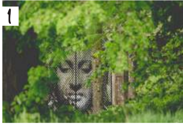
1. Domaine de Kerguéhennec