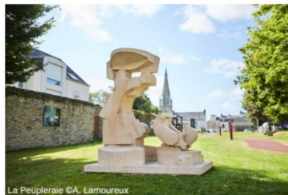
La Peupleraie ©A. Lamoureux