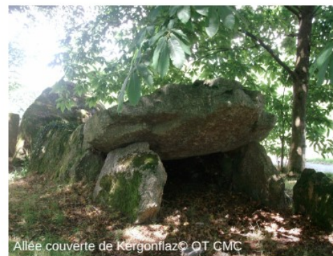
Allée couverte de Kergonfalz